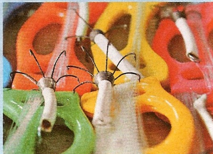
釣墨魚需要採用這些特製八爪鉤，鉤上有白色膠條，可在水底反光吸引墨魚視線。

據船家表示，若果想釣大墨魚，應將八爪釣放到水深20呎以下，因為大墨魚最愛在深水出現。而接近上面的則多是小墨魚，因為小墨魚的防範能力較低，而且較為貪食，上釣機會亦較成熟的墨魚為高。船家更即場講解及示範，釣墨魚不需要太大動作，否則很難釣到。經驗老到的船家說畢，又再釣到墨魚，隨即團友亦此起彼落的尖叫，收穫認真豐富！不過要注意，一些較大的墨魚上釣及離開水面時，會因自衛而噴出墨汁。