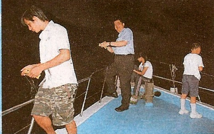
夜釣墨魚吸引不少大批港人參與。

發達行負責人指出，九十年代初，港島與西貢區的海灘相繼發生鯊魚襲擊事件，參加水上活動的人次大幅下降，旅行社的「水線」與遊艇租賃服務當然大受影響，不過香港人腦筋轉得快，想出釣墨魚團新玩意，這個概念是由「發達行」領導層一手想出和策劃，推出市面後，迅即成為熱潮，吸引大批港人試玩，參加「水線」出海的人次不斷上升，業界亦爭相開辦相關行程，成功令業界轉危為機。