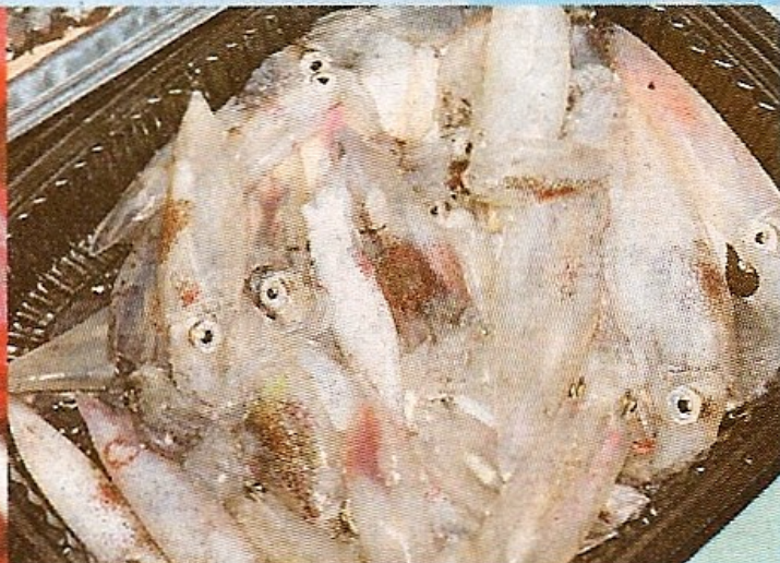
釣墨魚很快就可上手，短短一小時收穫已甚為豐富。

發達旅遊（國際）有限公司 總行：九龍彌敦道639號雅蘭中心1期16樓1615室 電話：2395 0788 網址：www.fth.com.hk